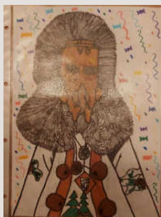
2. Darius K.